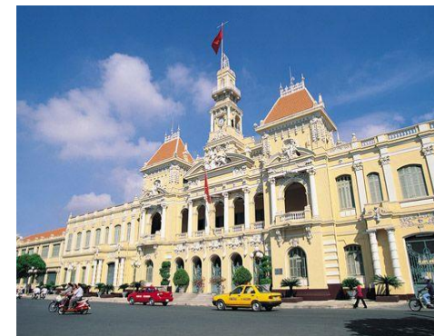
Queen Ann hotel**